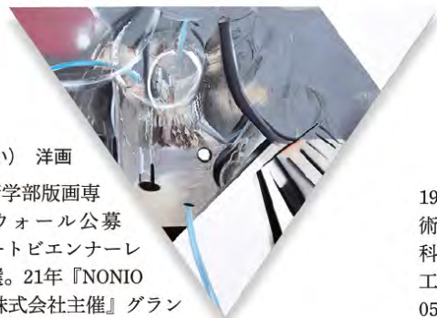
「呼び継ぎ(祭り囃子)」

1988年宇治市生まれ。京都精華大学芸術学部版画専攻卒業。12年『トーキョーワンダーウォール公募2012/東京都主催』入選。13年『D アートビエンナーレ2013/ 掘科学芸術振興財団主催』入選。21年『NONIO ART WAVE AWARD 2021/ ライオン株式会社主催』グランプリ・NONIO 賞。成安造形大学非常勤講師。