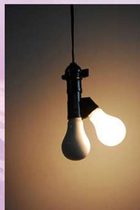
Emptiness (Light Bulb)